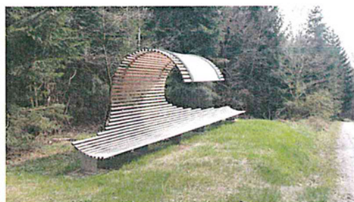
„back to the bench“

Geführte Gruppenwanderungen sind auf allen unseren Teilstrecken möglich. Die ARS-NATURA Stiftung bietet Ihnen individuelle Beratung zu einzelnen Teilstrecken an. Jede Strecke hat ein eigenes künstlerisches Motto und landschaftliche Besonderheiten.